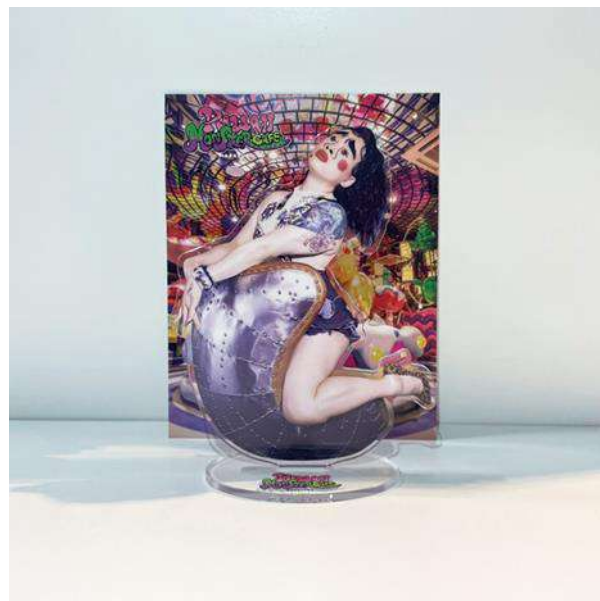
第1弾 オリジナルアクリルスタンド 「自立式ブリアナ・ギガンテ」